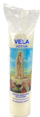
VELA VOTIVA 7 DIAS NOSSA SENHORA DE FÁTIMA FINA