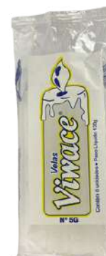
VELA N° 5 G