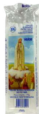
VELA Nº 10G NOSSA SENHORA DE FÁTIMA