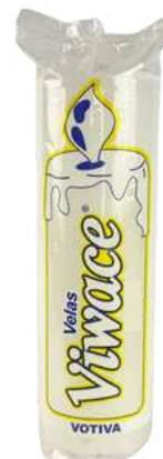
VELA VOTIVA 7 DIAS