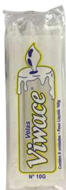
VELA N° 10 G