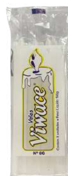
VELA N° 8 G