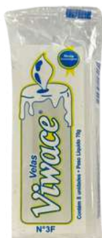
VELA N° 3 F