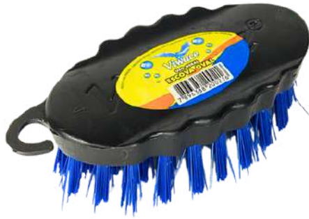
ESCOVA OVAL DE PLÁSTICO