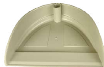
PÁ PARA LIXO CABO LONGO