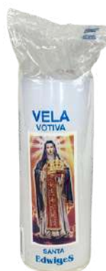
VELA VOTIVA 7 DIAS SANTA EDWIGES