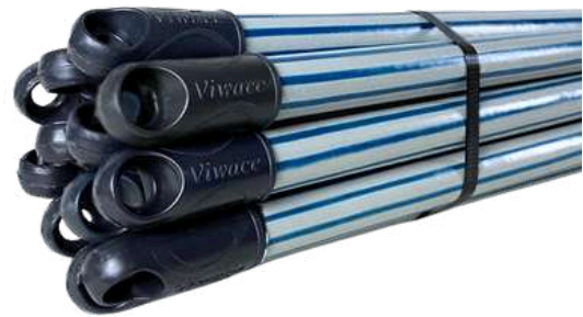
CABO DE MADEIRA