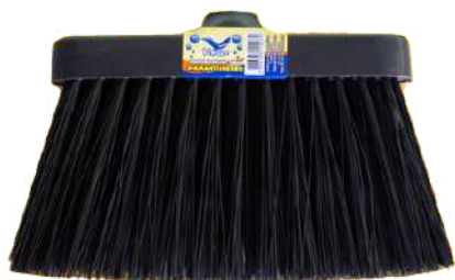
VASSOURA DIAMANTE NEGRO-PIAÇANIL