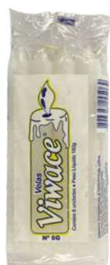
VELA N° 6 G