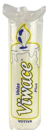
VELA VOTIVA 7 DIAS PLUS