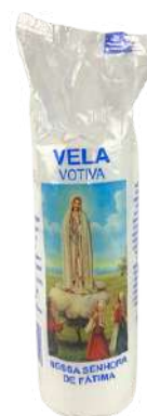
VELA VOTIVA 7 DIAS NOSSA SENHORA DE FÁTIMA